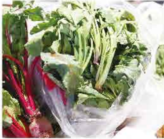
▲採れたて新鮮野菜

奥様が、子ども食堂を初めて立ち上げた方の特集をテレビで見て、ご自分の育った環境とリンクし、自分にも何かできることはないかと色々調べたところから始まったそうです。共働きや母子家庭の多い近年、子供だけで食事したりコンビニで買った食事で済ませてしまいう子供に、温かく美味しい食事をみんなで楽しく食べてもらいたい!というオーナーご夫婦の温かい気持ちからスタートしました。