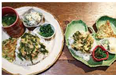
▲この日のメニューはにら玉丼・ねぎ焼き・ほうれん草胡麻和え・ブロックリーとじゃがいものサラダ・野菜スープ

毎月豊田市のお知り合いの方から無償で、畑で採れた旬の無農薬野菜を提供していただいています。そこからメニューを考え、採れたて新鮮野菜たっぷりの美味しいごはんが出来上がります。お母さんとお子様で来店される方がほとんどで、みんなでワイワイ楽しくご飯を食べたり遊んだりする場になっています。お邪魔した日は、保育園のお友達同士で毎月来ているというご家族が楽しくお食事されていました。今後の課題として、「本当は一人でお留守番をしている子や子供だけで家で食事をしている子に、気軽にお子様だけでご飯を食べに来てほしい」と思っています。とおっしゃっていました。お子様だけの来店は無料で提供されていますので、この活動が今後広まると良いと思います。