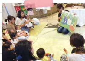
絵本の読み聞かせに夢中...