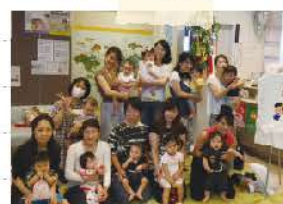
最後にみんなでハイチーズ!