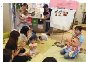
ママとのふれあい楽しい☆