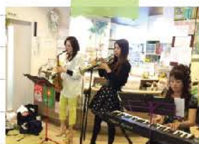
暑さ入ってしまう演奏も!